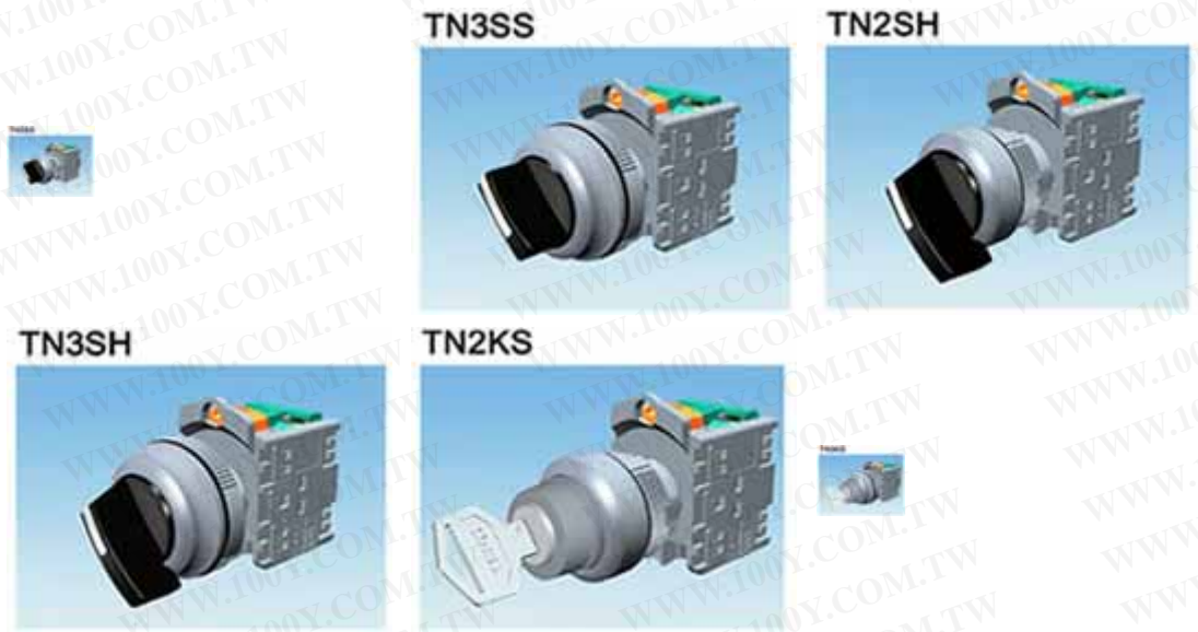
選擇開關二段接點圖

勝特力材料 886-3-5753170 勝特力电子(上海) 86-21-54151736 勝特力电子(深圳) 86-755-83298787 Http://www.100y.com.tw